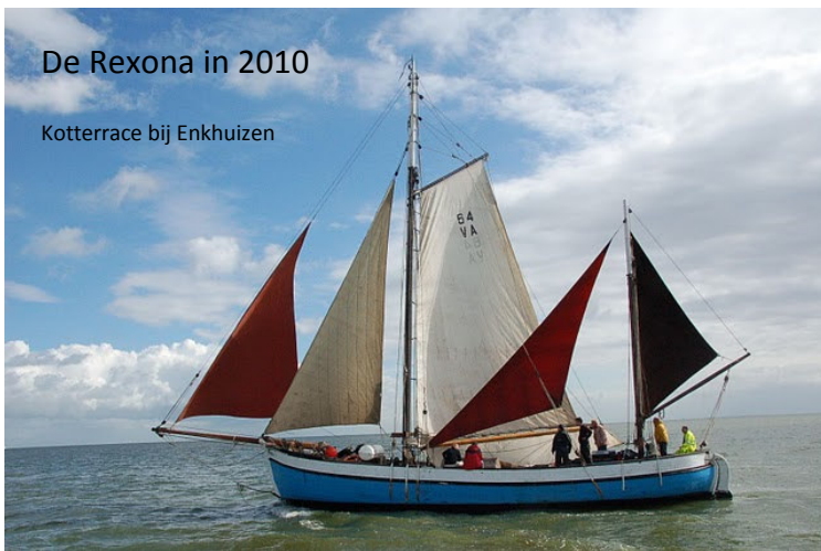
De Rexona in 2010