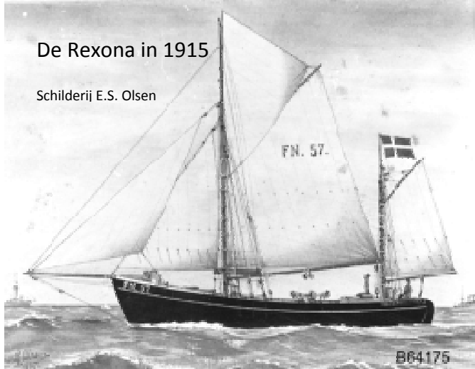
De Rexona in 1915

Er is ook gelegenheid aan boord te overnachten voor wie wan ver komt.